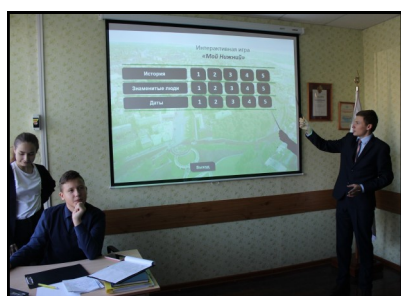
Страницу к публикации подготовила руководитель музея И.А. Аввакумцева